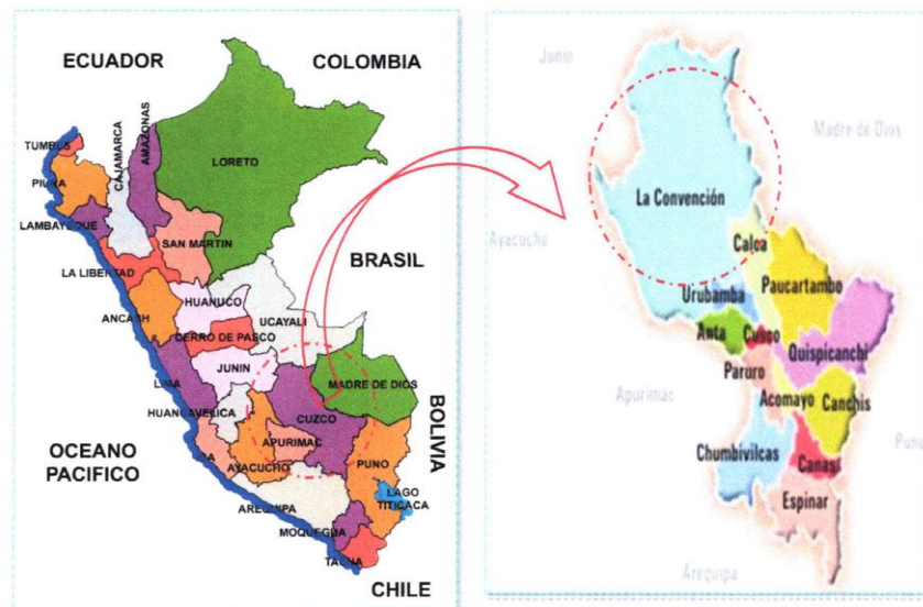
MAPA N° 2 UBICACIÓN PROVINCIAL Y DISTRITAL