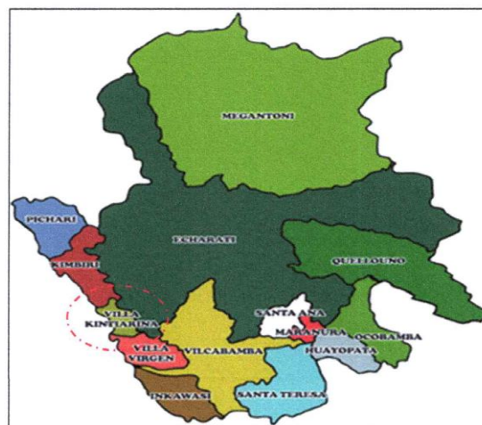
MAPA N° 3 UBICACIÓN DISTRITAL Y CENTROS POBLADOS