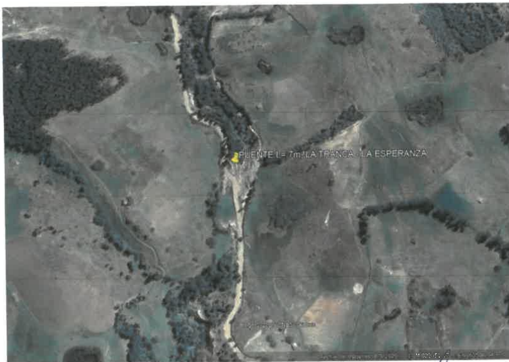
Figura N° 3. Ubicación satelital del puente

INVERSION: "RENOVACION DE PUENTE; EN EL(LA) VÍA VECINAL R060231; TRAMO CAUDAY - EL BOSQUE - LA ESPERANZA (PUENTE LA TRANCA) EN LA LOCALIDAD LA ESPERANZA, DISTRITO DE CONDEBAMBA, PROVINCIA CAJABAMBA, DEPARTAMENTO CAJAMARCA" CUI N° 2578220.