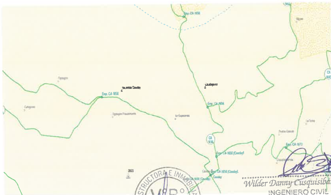
Figura N° 2. Mapa Vial

Wilder Danny Cusquisiban Ocas INGENIERO CIVIL CIP: 175143