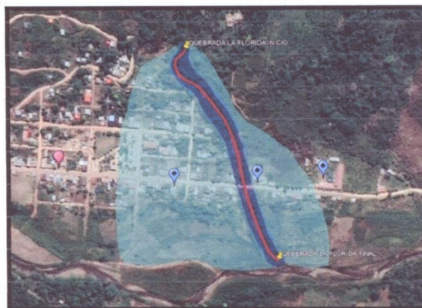
CROQUIS DEL TRAMO A INTERVENIR