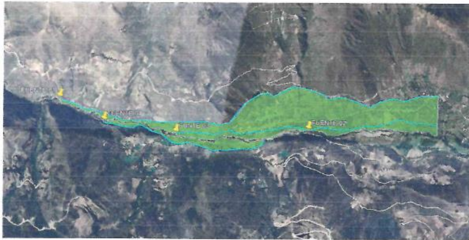
Grafico N° 02: área de influencia.

En el siguiente cuadro se puede apreciar las 51 hectáreas de terreno con fines de producción de palta y cereales de climas cálidos.