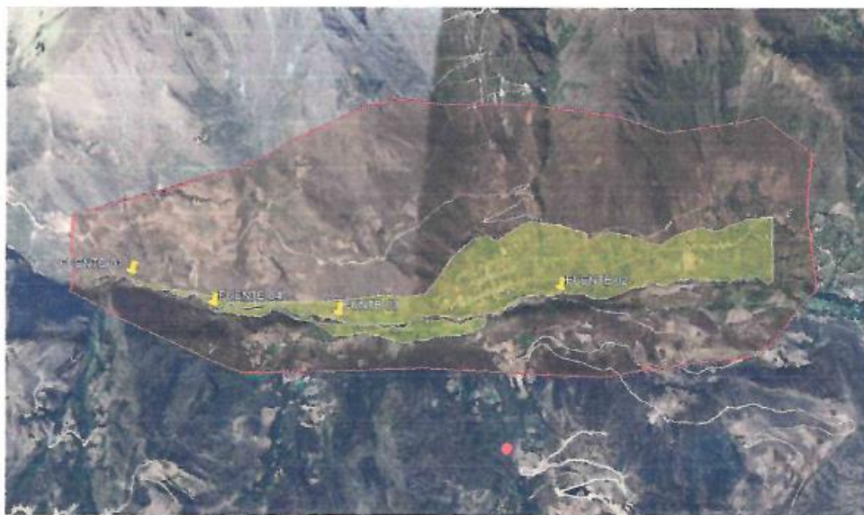
Gráfico N° 01: área de estudio y área de influencia.