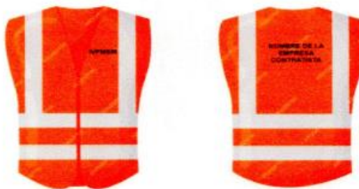
Imagen Chaleco de seguridad