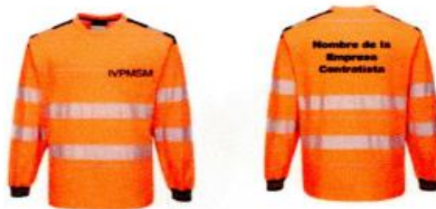
Imagen Polo Manga Larga de seguridad