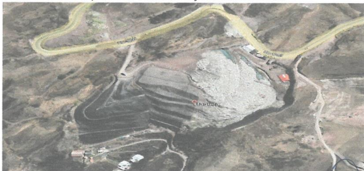
Foto: Ubicación de Obra - Jaquira

El lugar de entrega será en el almacén de la obra ubicado en el Botadero Controlado de Jaquira, en la localidad de Jaquira (7.5 km de la ciudad del Cusco en el tramo de la carretera de Cusco a Ccorca, al Sur Oeste de la ciudad del Cusco, distrito de Santiago, Provincia y Departamento de Cusco). El horario de entrega del bien será en el horario de trabajo de lunes a viernes de 7:00 am a 1:00 pm y en la tarde de 2:00 pm a 4:30 pm y los días sábados de 7:00 am a 12:00 pm, fuera de este horario no se recibirá el bien, tomar las previsiones del caso de verificarse bienes defectuosos la reposición de los se realizará en un término de 02 días calendarios, para lo cual deberán de presentar declaración jurada en la oferta.