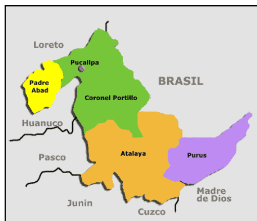
Mapa macro localización del departamento de Ucayali