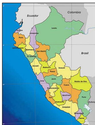
Mapa de macro localización del Perú