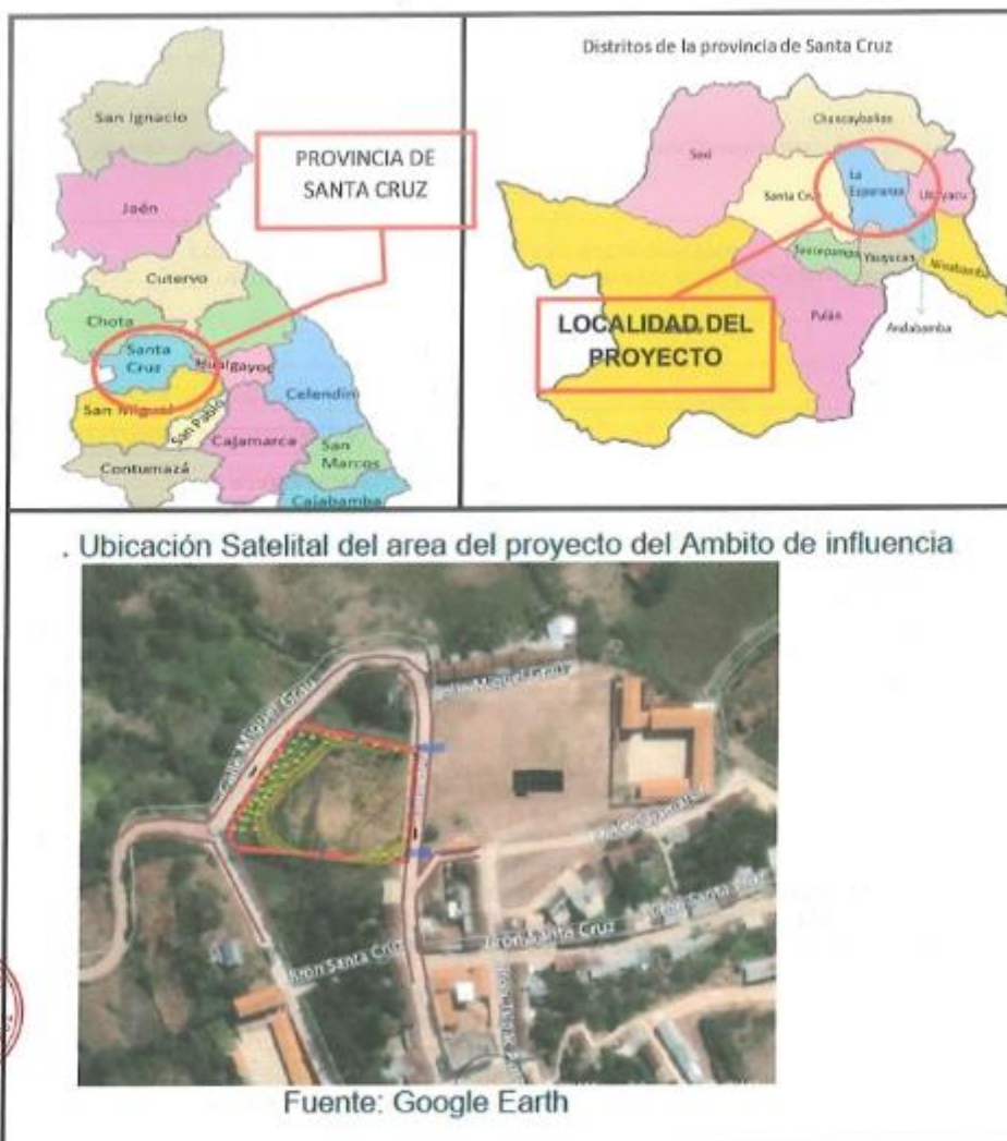
MAPA DISTRITO DE LA ESPERANZA