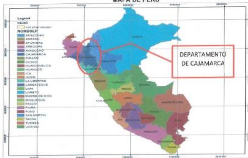
MAPA DE PERÚ

Región : Cajamarca Provincia : Santa Cruz Distrito : La Esperanza Localidad : La Esperanza