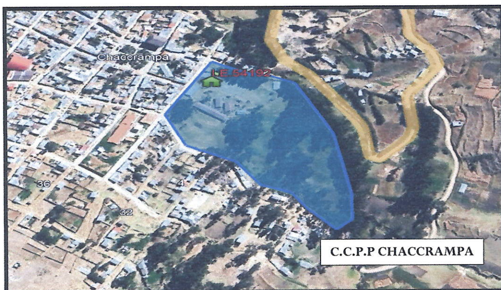
IMAGEN N° 01 MICRO LOCALIZACION DEL PROYECTO