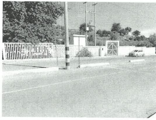
Estación de Bombeo El Totoral

Se está proyectando una Cisterna Enterrada de V=320.00\text{m}^3 la misma que regulará y abastecerá toda el área de influencia, esta se encuentra ubicada dentro de la Estación de Bombeo El Totoral, terreno perteneciente a la EPS Moquegua S.A.