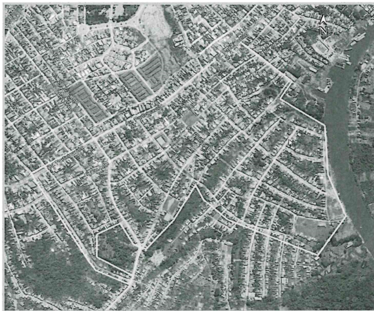
Imagen: Área del proyecto

La accesibilidad a la zona del proyecto es por vía terrestre a través de motos, moto taxi, transporte público, auto móvil, etc, con una duración de 15 minutos del centro de la ciudad de Iquitos. Se accede a la zona del proyecto a través de la Av. Participación el cual es de característica asfaltada y una de las vías más importantes de la ciudad, por lo que el acceso no representa una dificultad por tratarse que el área de trabajo se encuentra dentro de casco urbano del distrito de Belén