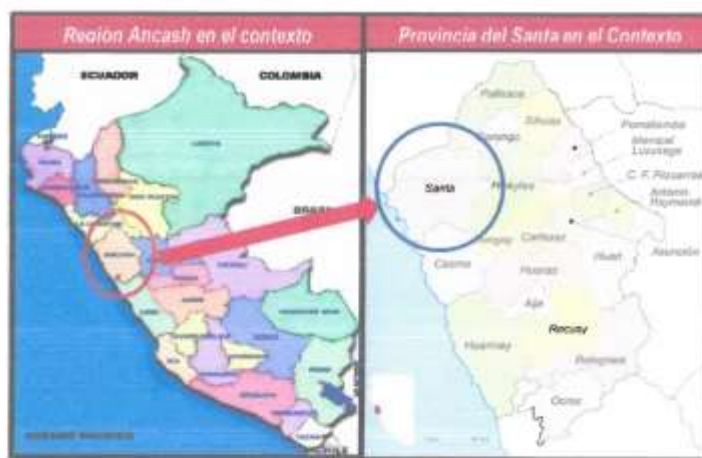
Mapa N° 01 Macro Localización Geográfica