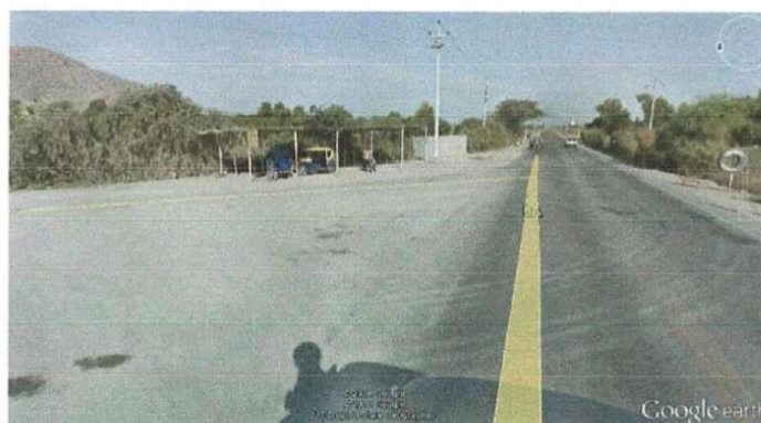
Figura N° 02: Vista de cruce CP. Conchucos.