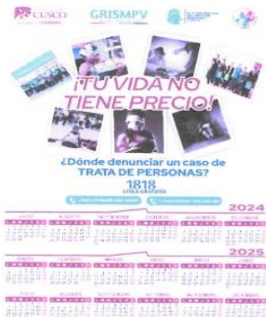
IMAGEN REFERENCIAL (MODELO 2)