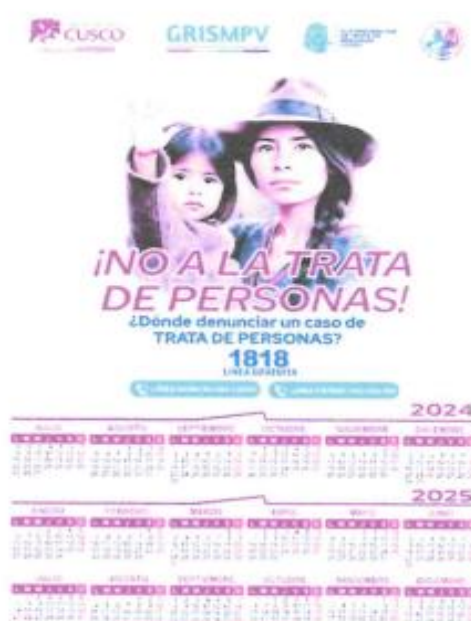
IMAGEN REFERENCIAL (MODELO 3)