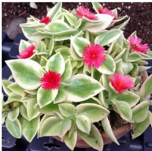
Mesembryanthemu m Cordifolium (Aptenia cordifolia variegada)

Toda copia de este documento, sea del entorno virtual o del documento original en físico es considerada "copia no controlada"