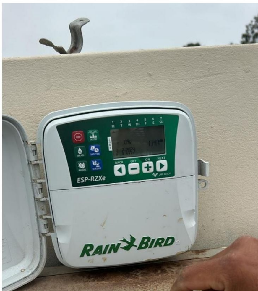
ANEXO FOTOGRÁFICO DE PLANTA NUEVAS A CAMBIAR REFERENCIAL