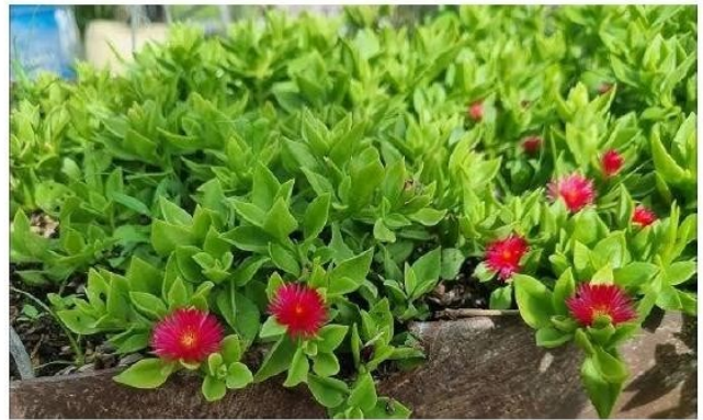
Mesembryanthe mum Cordifolium (Aptenia cubresuelo verde)