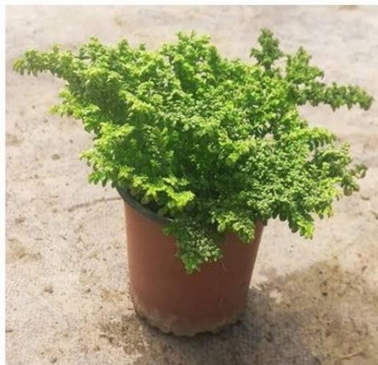
Pilea microphylla (Lentejita)