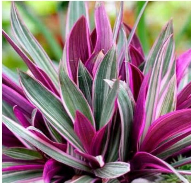
tradescantia spathacea (rhoeo tradescantia)