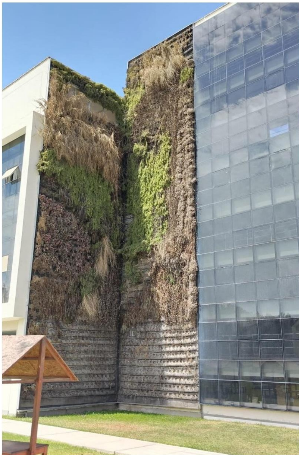
Estado situacional del Jardín Vertical a Intervenir

Toda copia de este documento, sea del entorno virtual o del documento original en físico es considerada "copia no controlada"