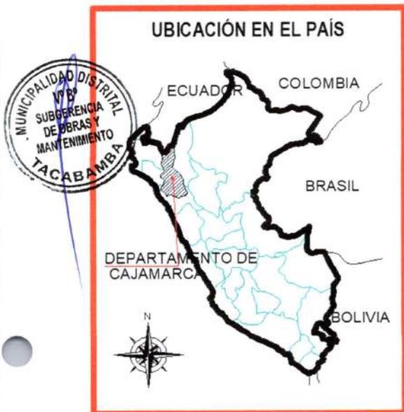
Ubicación en el País