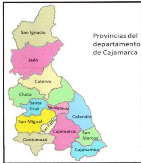
Ubicación de la provincia de Chota