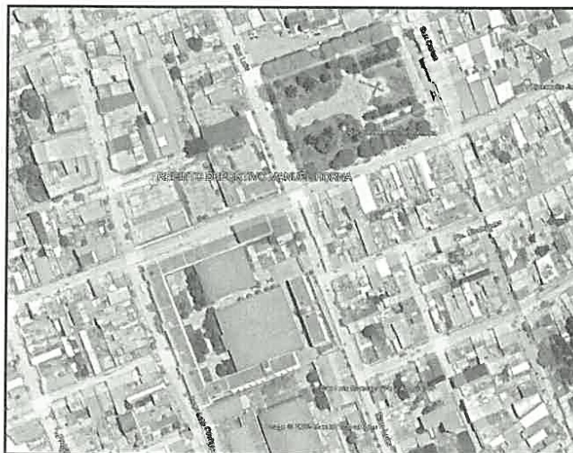
Vista del Sector Morro Solar parte Alta – Recinto Deportivo Manuel Horna