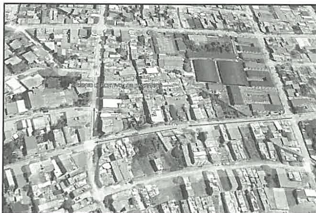
Vista del Sector los Bancarios – Recinto Deportivo Los Bancarios