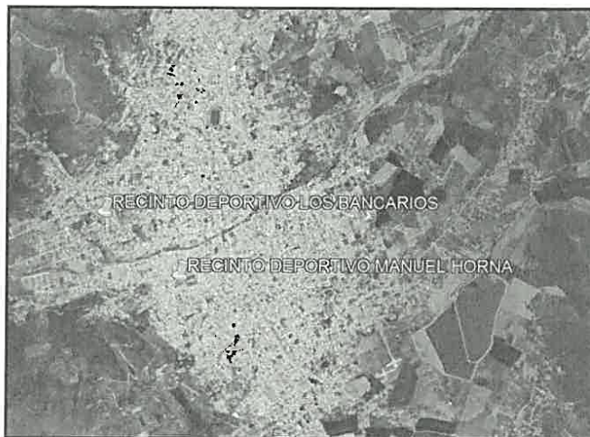
Vista General de la ciudad y la ubicación de los 02 recintos deportivos.

Provincia : Jaén. Distrito : Jaén. Sector : Morro Solar y Los Bancarios