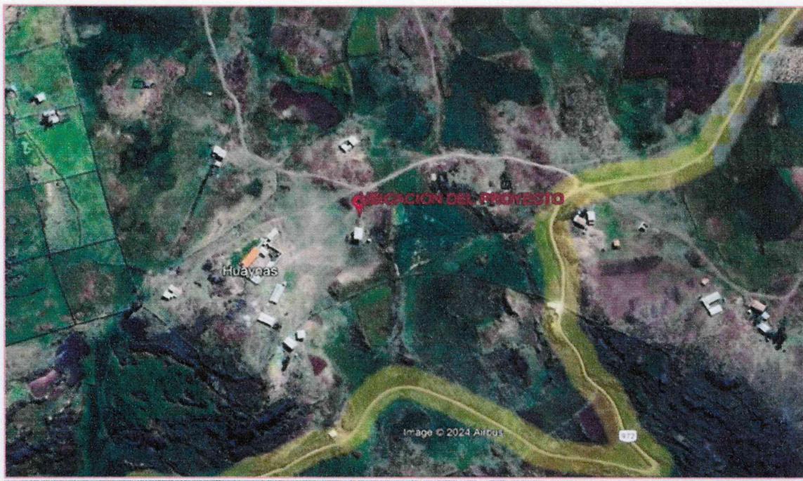
Figura N° 01

Región : La Libertad. Provincia : Julcán. Distrito : Huaso. Caserío : Huaynas.