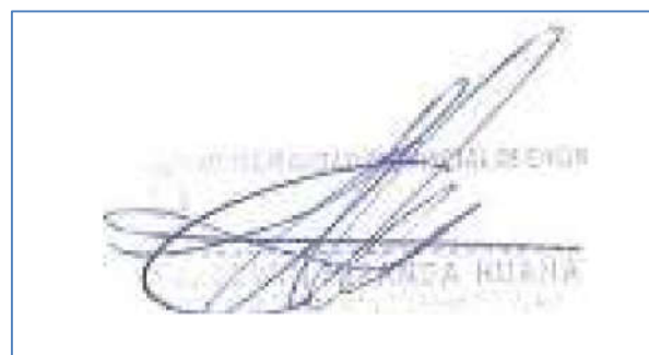
(Imagen ampliada hasta un 400%)