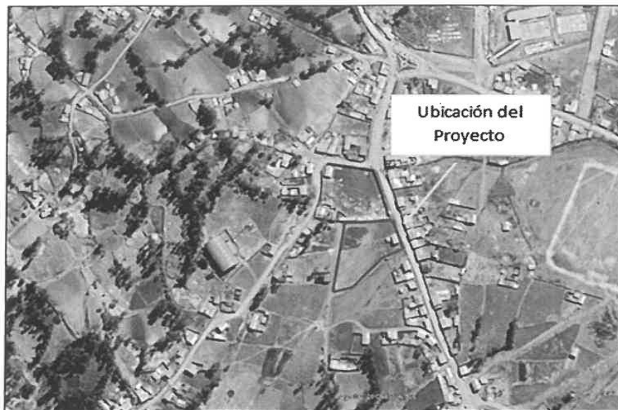
Imagen 02: Ubicación Satelital IEI - N° 264 de Ancatira