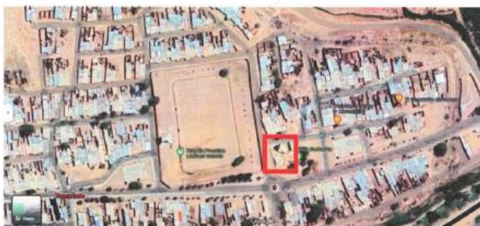
Ubicación de la I.E. SANTO DOMINGO DE GUZMÁN

La Ciudad de Tamarindo se encuentra en la Provincia de Paíta, para llegar a la zona del proyecto se puede viajar desde la ciudad de Piura hacia Paíta, Luego de la ciudad de Paíta al distrito de Tamarindo a través de Buses Interprovinciales y Autos-Colectivos en un tiempo aproximado de 1h 30 –min o desde la ciudad de Sullana Para llegar a él se sigue la carretera Panamericana en la ruta Sullana – Talara, a 30 minutos de Sullana; en el distrito de Ignacio Escudero está el desvío que indica: Tamarindo o Talara, siguiendo hacia la izquierda, bastan 10 minutos en auto para llegar a destino.