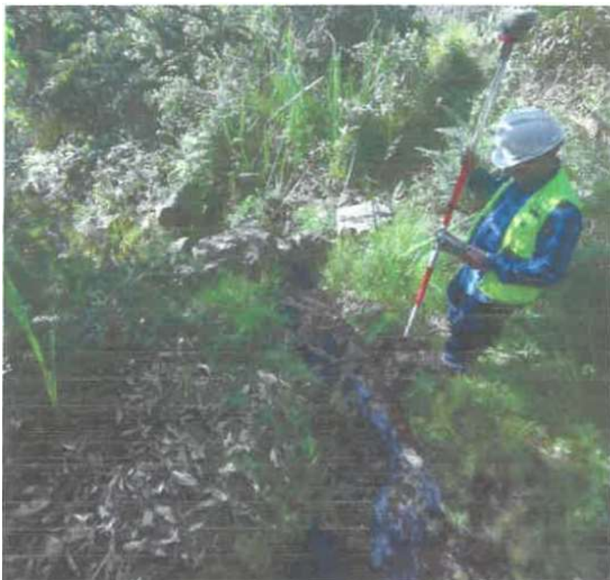
Foto 02. Canal labrado en suelo natural, con secciones irregulares, superficial.