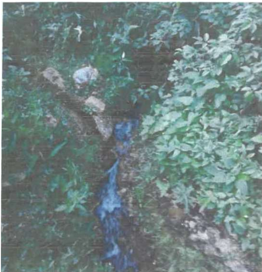
Foto 01. Canal de conducción de agua en terreno natural, el caudal es bajo y la escorrentía se da en canal labrado generando arrastre de suelo y pérdidas por filtración. Punto de confluencia de 2 captaciones.