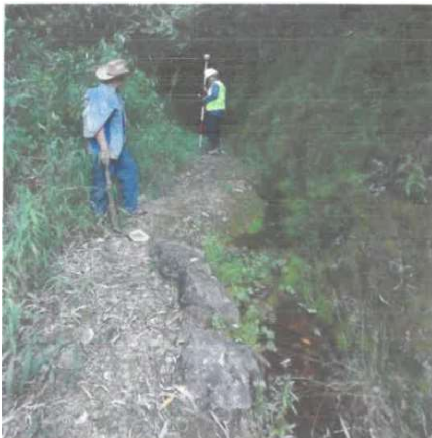
Foto 03. Canal labrado en suelo natural, con secciones irregulares, superficial, con sedimentos, hojarasca y hierbas lo que genera resistencia al desplazamiento del agua, reduciendo el caudal disponible y la velocidad de desplazamiento.

Se percibe caudales bajos de disponibilidad de agua, el canal de conducción es labrado sobre suelo natural y debido a las características propias con el tiempo ha generado secciones irregulares en su recorrido, la presencia de malezas, hojarascas y sedimento generan la reducción de la velocidad de desplazamiento generado a la vez pérdidas por filtración y reduciendo considerablemente la disponibilidad de agua para riego a los beneficiarios.