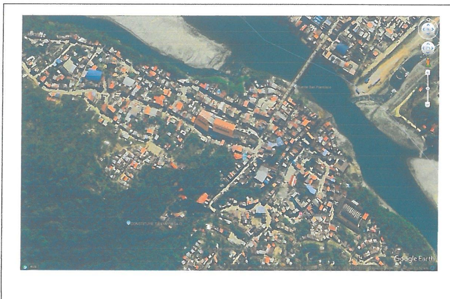
Ubicación del proyecto.