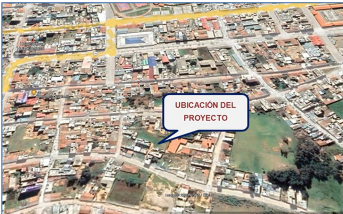
IMAGEN 04. UBICACIÓN GEOGRÁFICA DEL LUGAR DE LA INVERSIÓN