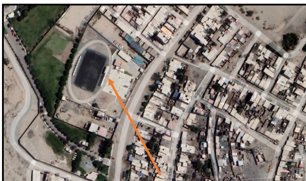
Micro Localización (Distrito Nuevo Chimbote – COMPLEJO DEPORTIVO EL SATELITE)