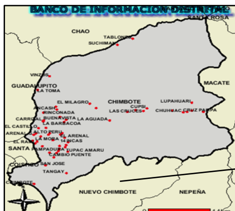
Provincia del Santa