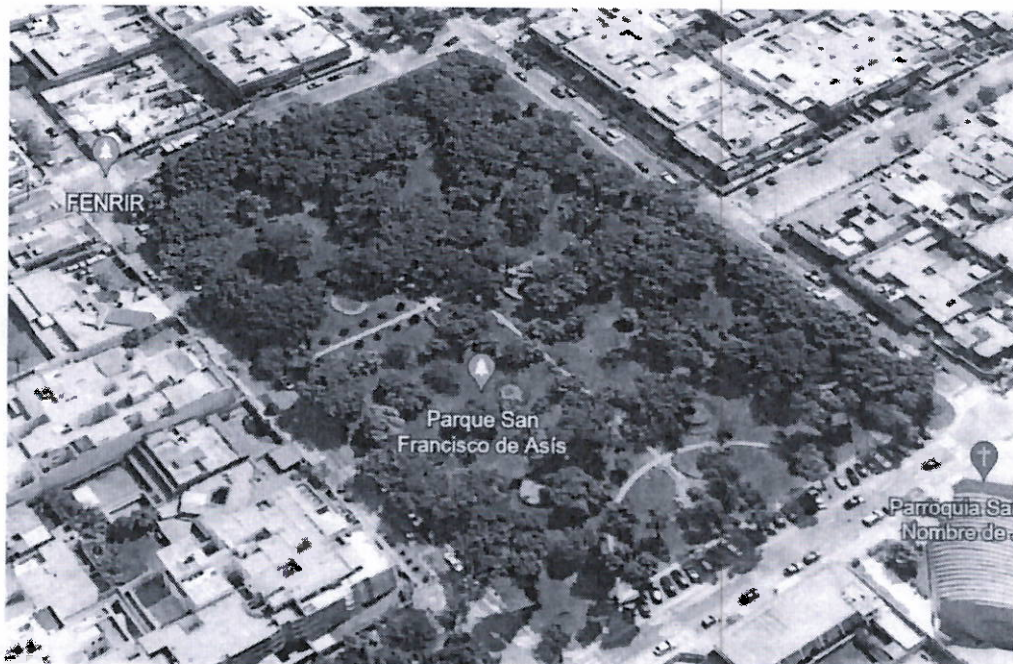
Imagen 1: Ubicación del Parque San Francisco