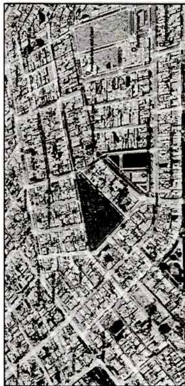
FOTOGRAFIA N.º 01. En la siguiente imagen se ve la ubicación satelital del terreno en donde se proyecta el parque recreacional, P. J. 07 DE JULIO

A nivel geográfico, el clima de la zona es cálido en los meses de verano, oscilando que la temperatura máxima llega a los 33°C y la mínima a los 13°C, con una temperatura promedio anual de 24°C, y durante los meses de invierno con presencia de niebla.