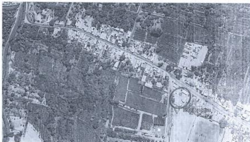
Imagen 1. Ubicación del Centro de Educación Técnico Productiva – CETPRO “LOS AQUIJES”.

Actualmente dicho Centro de Educación brinda los servicios educativos en la Avenida Principal S/N H Lote 1 del Centro Poblado Los Piscontes del Distrito de Los Aquijes, el mismo que se encuentra inscrita en la Oficina Registral Regional con Partida Registral N°P07046214, siendo el área inscrita de 2,746.00 m2.