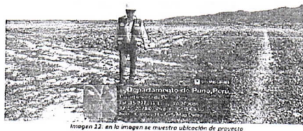
Imagen 12: en la imagen se muestra ubicación de provincia

Metodología propuesta, el PLAN DE TRABAJO punto 15.- se pide " Conocimiento del Lugar del Proyecto, adjuntar fotografías georreferenciadas", el consultor adjunta fotos georreferenciadas que no están en el área de influencia del proyecto.