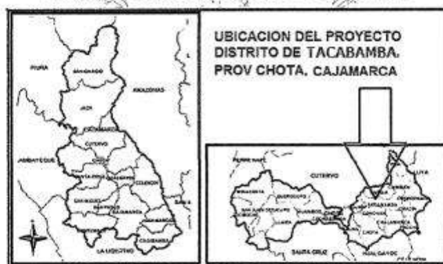
Imagen N° 01. Mapa del distrito de Tacabamba

Nivel de los estudios de preinversión, según corresponda Fecha de declaración de viabilidad, de ser el caso