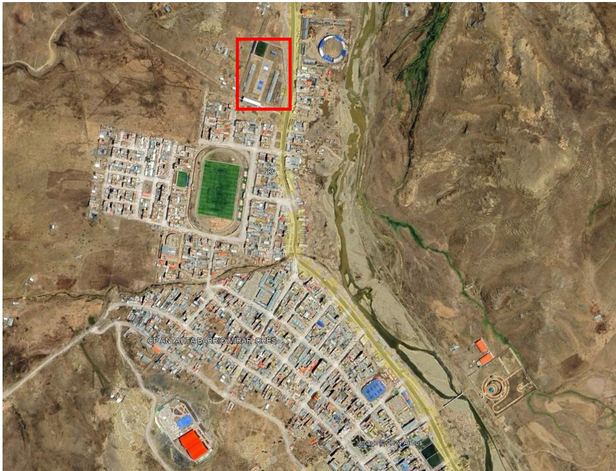
Elaboración de Equipo Técnico -2023