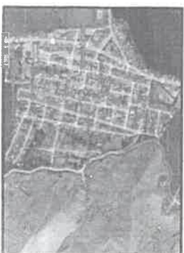
Vista satelital de la localización del proyecto, en la imagen se muestra LA IE 88331, la cual tiene las coordenadas UTM mencionadas en el cuadro superior.