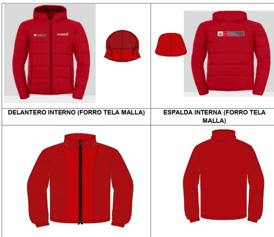
DELANTERO INTERNO (FORRO TELA MALLA)

"Año del bicentenario, de la consolidación de nuestra independencia y de la conmemoración de las heroicas batallas de Junín y Ayacucho"