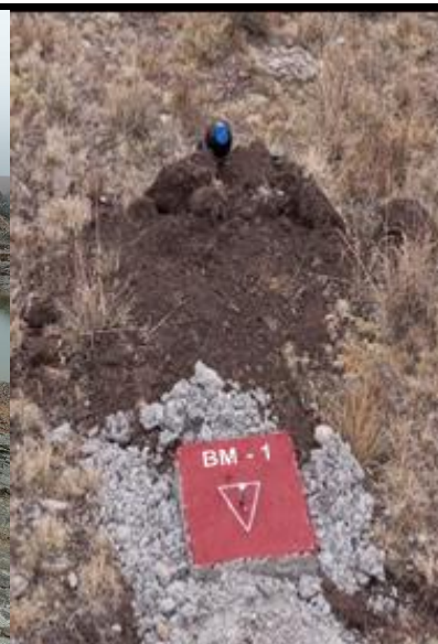
VISTA DEL BENCH MARK (BM) MONUMENTADO Y/O PINTADO