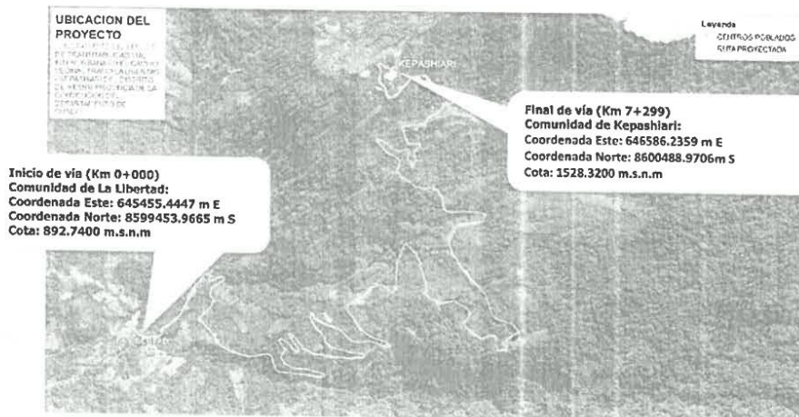
Imagen N° 01: Ubicación localidades beneficiarios en GOOGLE EARTH.

Se ubica en el Tramo Libertad y Kepashari, (Eje único y principal) las coordenadas de estos lugares son las siguientes: