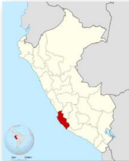
Figura N° 2: Ubicación del lugar de la obra en el Mapa político del Departamento de Ica.