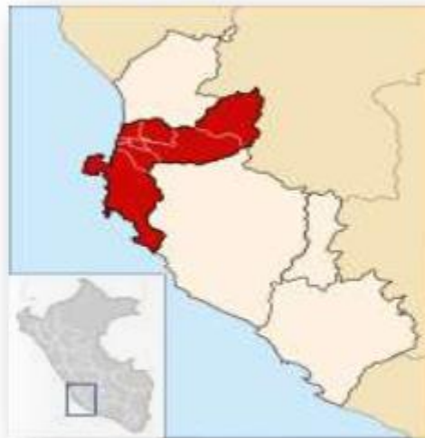
Figura N° 3: Ubicación del Distrito de Huancano