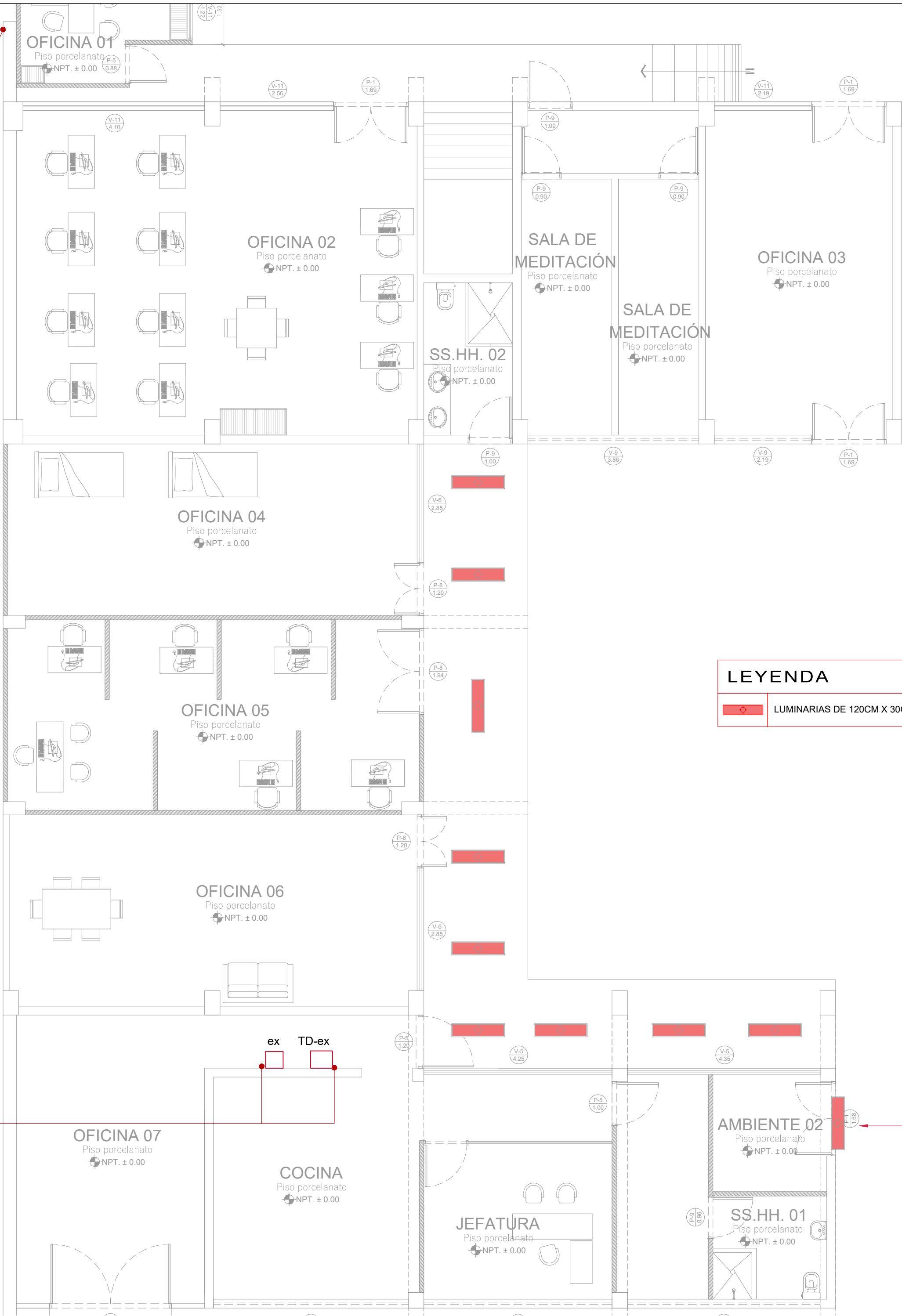
PLANO PRIMER NIVEL ESC:1/75