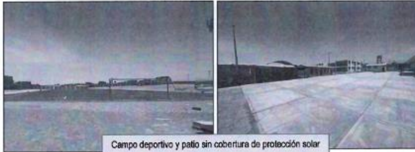
Campo deportivo y patio sin cobertura de protección solar