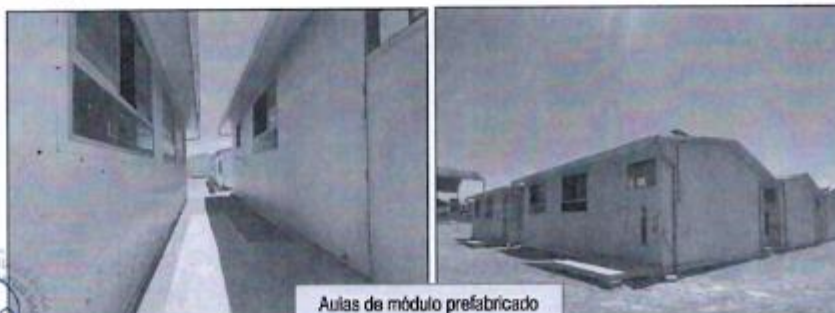
Aulas de módulo prefabricado