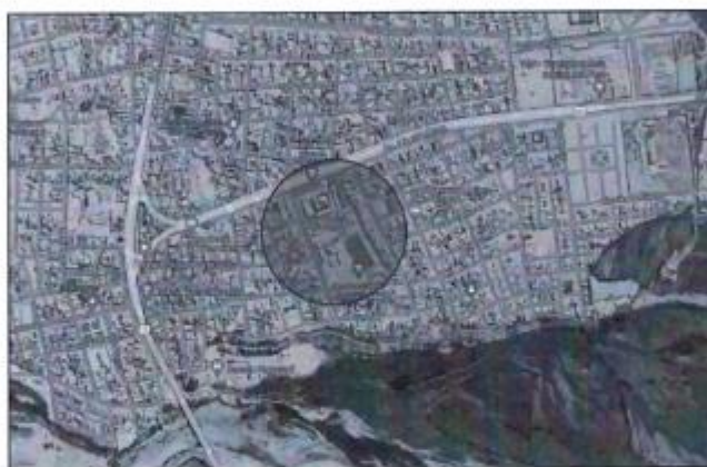
Imagen. Ubicación de la Institución Educativa Nivel Primaria y Secundaria José Carlos Mariátegui – C.P. San Clemente.

La Institución Educativa Nivel Primaria y Secundaria José Carlos Mariátegui, se encuentra ubicada en el Centro Poblado de San Clemente, distrito de San Clemente, provincia de Pisco y departamento de Ica, cuyo terreno se encuentra inscrito en los registros públicos a favor del Ministerio de Educación en la partida N°P07061144 con un área de 37,849.3 m2.