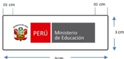
FIGURA N° 01

Medidas: Este logotipo tendrá 9 cm de largo x 3 cm de alto. El tipo de logotipo será la siguiente: