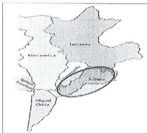
Distritos de la provincia de Sullana

Calles y/o avenidas : Santa Marta, San Francisco, Ricardo Palma y San Carlos. Centro poblado : Huangala Distrito : Sullana Provincia : Sullana Departamento : Piura