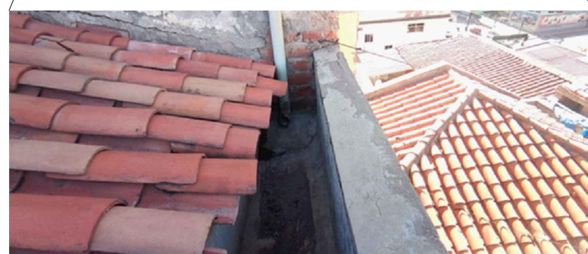
CANAleta DE CONCRETO EN MAL ESTADO