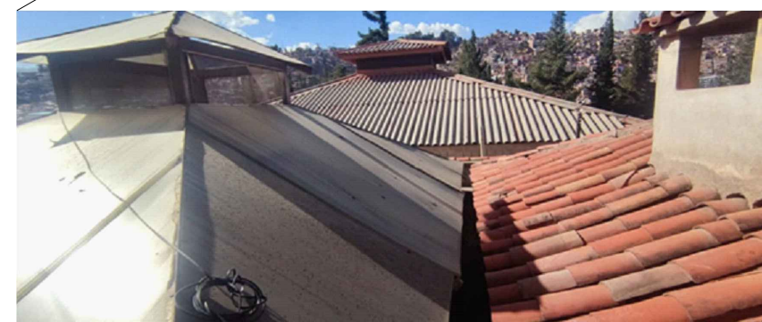
COBERTURA DE POLICARBONATO EN MAL ESTADO