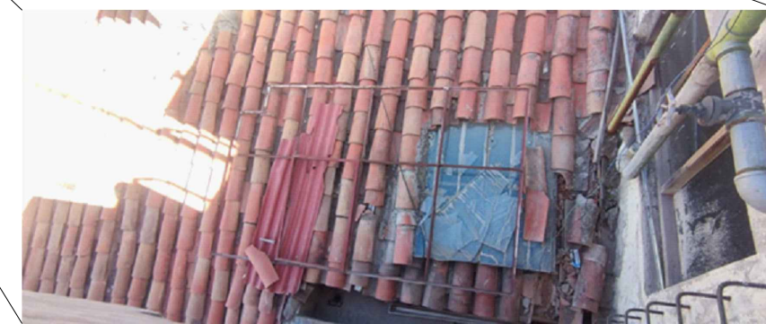
COBERTURA DE TEJA ANDINA EN MAL ESTADO