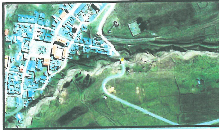
Plano de la ubicación del puente con relación al distrito de Quehue.

El Puente carrozable Quehue se encuentra ubicada a 153 km aproximadamente en dirección sur de la ciudad de Cusco.