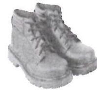
Zapatos de Seguridad con Punta de Acero