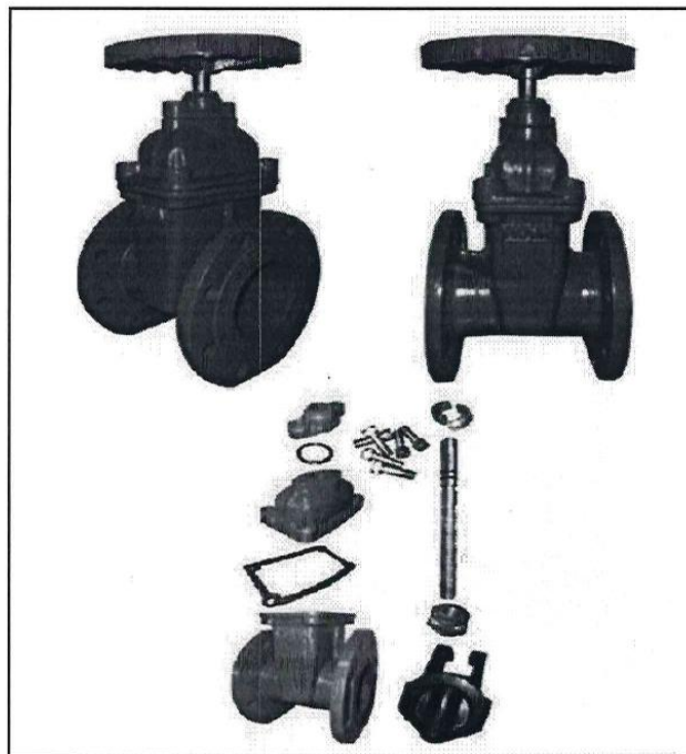
FIGURA 1: IMAGEN REFERENCIAL VALVULA COMPUERTA HD BB