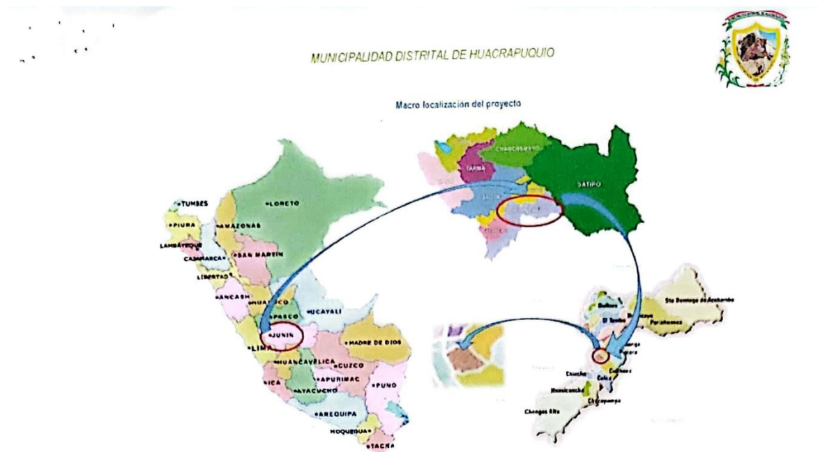
Localización geográfica de la unidad productora