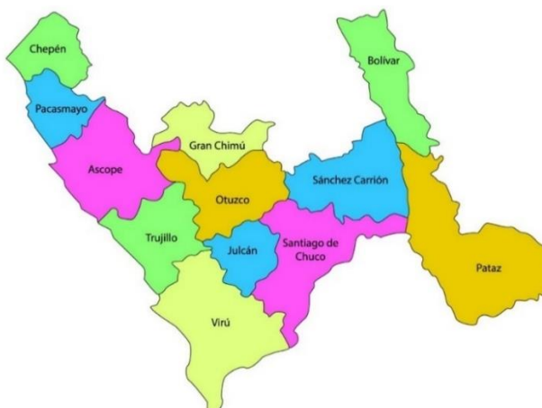
Figura N° 02 Ubicación zona de la Obra:

Mejoramiento y ampliación del servicio de energía eléctrica mediante sistema convencional en el caserío San José Alto, distrito de Santiago de Cao- Ascope, departamento de La Libertad.