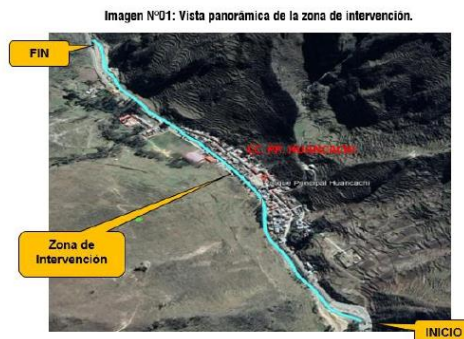
Imagen N°01: Vista panorámica de la zona de intervención.