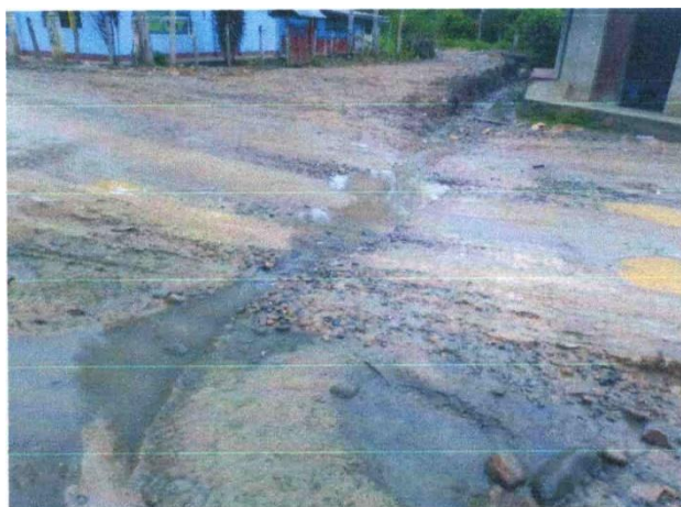
Foto 01 muestra las condiciones del sistema de drenaje pluvial

A continuación, se presentan fotografías con las características del cauce que está operando actualmente: