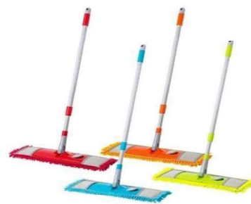
TRAPEADOR DE MICROFIBRA CON MANGO RECUBIERTO DE PVC