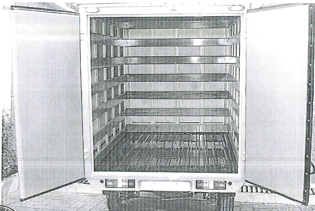
IMAGEN QUE SE DEBE TOMAR EN CUENTA PARA ABSOLVER LA CONSULTA N° 1

"Año de la unidad, la paz y el desarrollo"